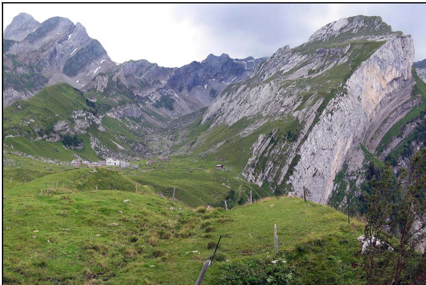
Altmann * Meglisalp * Ageteplatte

Eine weitere spektakuläre Route ist von der Meglisalp über die Ageteplatte zum Mesmer [Markierung: "weiß–rot–weiß"]. Von der Meglisalp [1517 m.ü.M.] geht es serpentinartig hoch auf die Ageteplatte [1939 m.ü.M.] – storziger [steiler], schweißtreibender Aufstieg bis zum Grat. [Grat-Überschreitung, 1896 m.ü.M.] Auf dem Grat oben angekommen sollte man einige Zeit inne halten und einfach das Panorama genießen. Oben auf dem Grat stehend [nichts für schwache Nerven – absolute Schwindelfreiheit und Trittsicherheit ist gefragt], hat man eine phantastische Aussicht über den Alpstein und zum Säntis rauf, der zum Greifen nahe scheint.